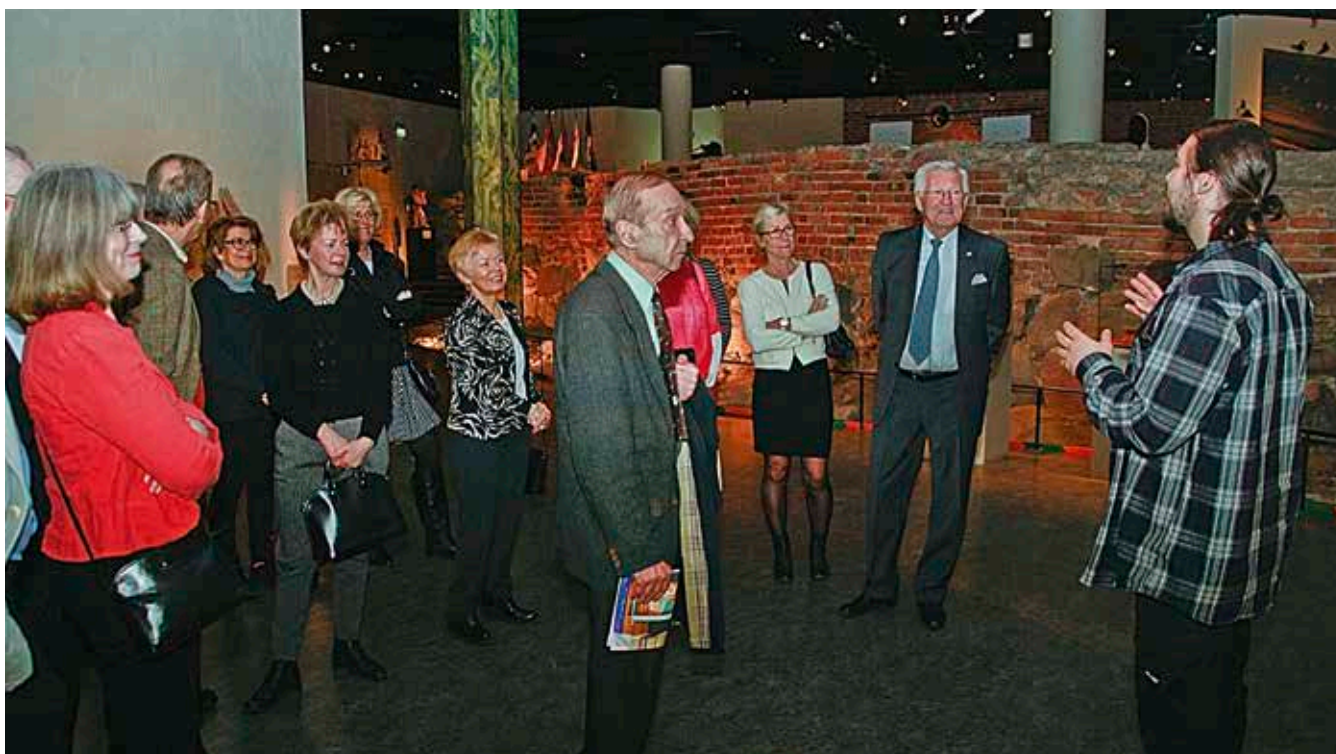
Intressant guidning på Medelhavsmuseet