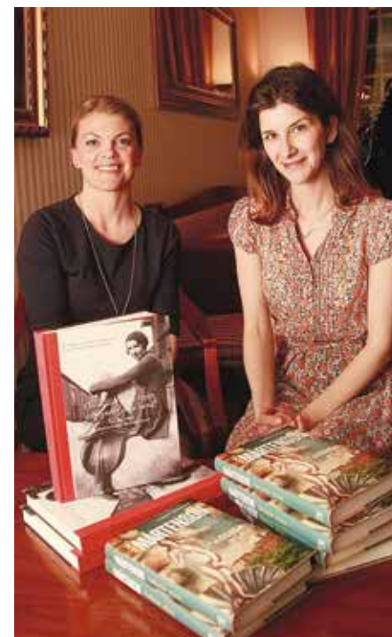
Bokförsäljning till specialpris i förlagets regi