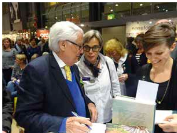
VSF signerade för glatta livet åt en glad Homanmedlem