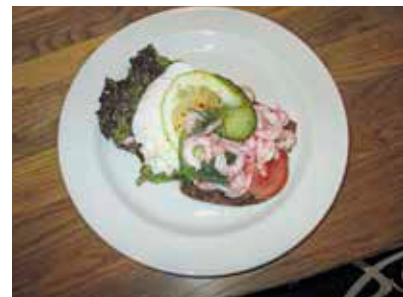
Den berömda Räksmörgåsen på Grilliska Huset. Omgjord och förnyad? men fortfarande mycket god