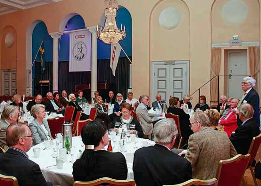
VSF berättar om Homan vid årsmötet i Banérpalatset