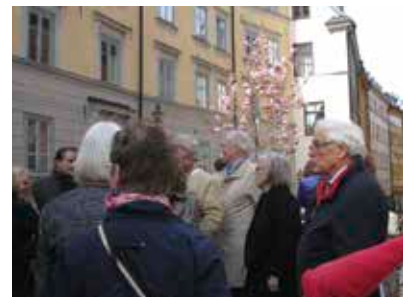
Blommande Magnolia i hörnet av Österlånggatan