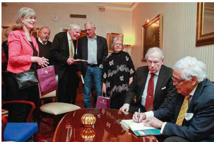
En lång kö entusiaster i väntan på att få den nya boken signerad av VSF

Vi som hade lyckan att vara med denna kväll fick köpa boken "Medicis ring" en dag före den släpps ut på marknaden. I natt är den värd guld, ifall vi hittar en köpare på vägen hem. Jag hann med sju kapitel innan jag var tvungen att skriva ett protokoll. Håll i hatten för det sker något ni aldrig kan ana i årets deckare!